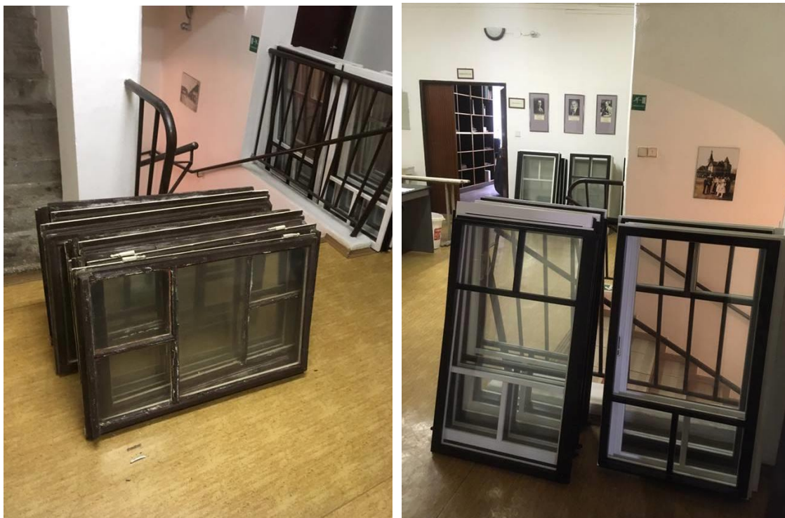
Původní dřevěná okenní křídla z roku 1909 (vlevo) a jejich nové dřevěné repliky (vpravo). Rámy dvojitých oken a vnitřní okenní křídla zůstaly původní.