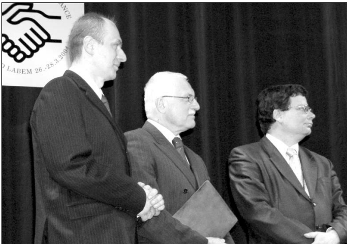
Konferenci ukončil svým projevem k česko-německým vztahům prezident V. Klaus. K úspěchu akce přispěl velkým dílem A. Vondra (vpravo).

Klaus: smířme se s minulostí. Pithart: ústecká iniciativa je historická.