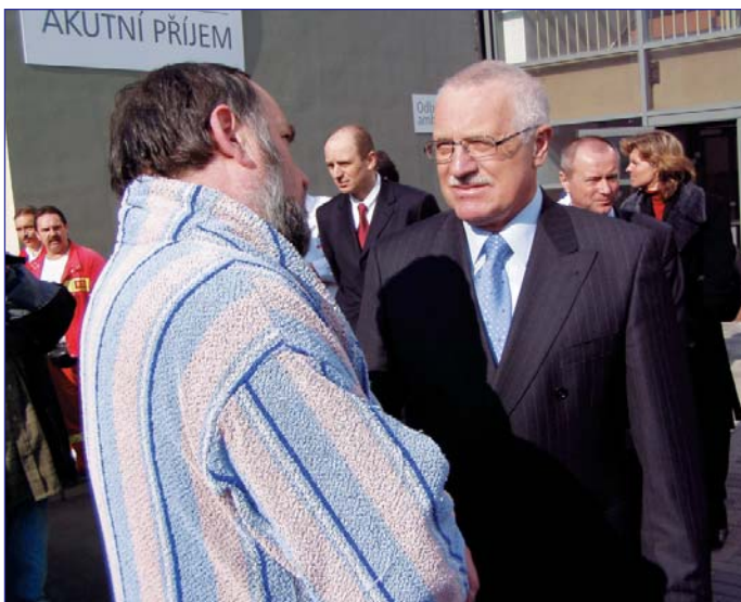
„Jak dlouho tady jste?“, zeptal se prezident pacienta.