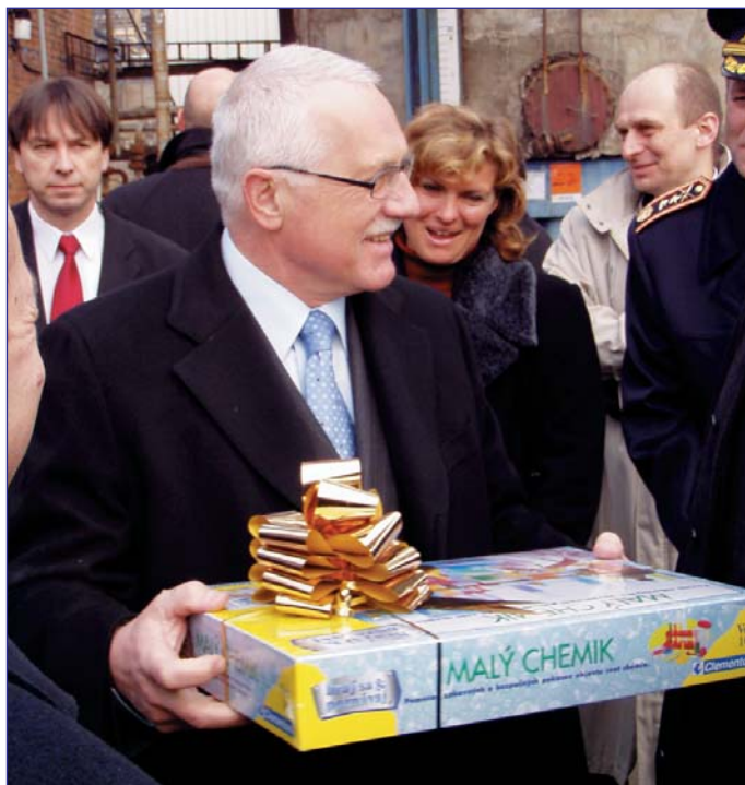
Spolek daroval Malého chemika. Vnoučata mohou dělat pokusy.

Prezidentský pár si rovněž prohlédl Masarykovu nemocnici a Spolek pro chemickou a hutní výrobu, jehož vedení