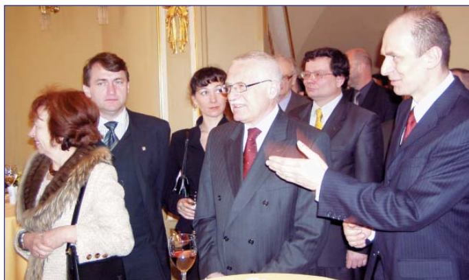
Přivítání prezidentského páru v Městském divadle.

pro něj připravilo další originální dar - sadu pro děti s názvem Malý chemik. Václav Klaus se podíval do výroby tuhých epoxidových pryskyřic a byla mu představena výstavba nového provozu základních epoxidových pryskyřic. Jde o nejlepší dostupnou technologii s japonskou licencí. Odpoledne se konalo na Lidickém náměstí setkání s občany, které bylo spojeno s autogramiádou nové knihy Václava Klause s názvem "Rok první". "Byl jsem překvapen