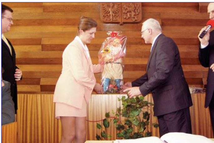
Trpaslík zabalený do fólie - takový dárek V. Klaus už asi nedostane...