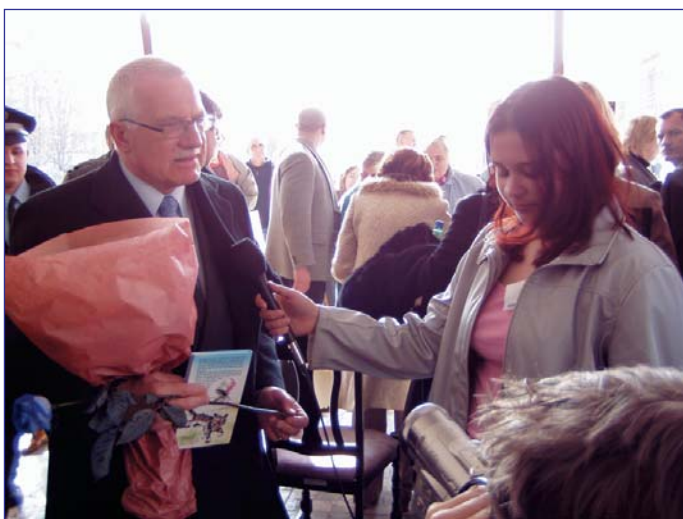
Děti v roli novinářů.