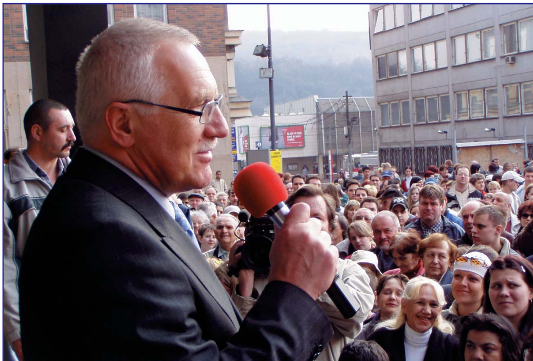
Prezident V. Klaus hovořil s Ústečany o Evropské Unii a podepisoval svou novou knihu.

Prezident republiky Václav Klaus Ústí nad Labem dlouhá léta sleduje a je toho názoru, že se "pohnulo viditelně kupředu". V. Klaus to řekl na mimořádném jednání Zastupitelstva města 29. března.