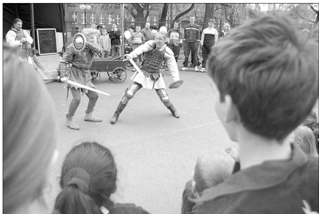
K divácký zajímavým atrakcím Dne otevřených dveří ve Spolchemii budou patřit i ukázky historického šermu.