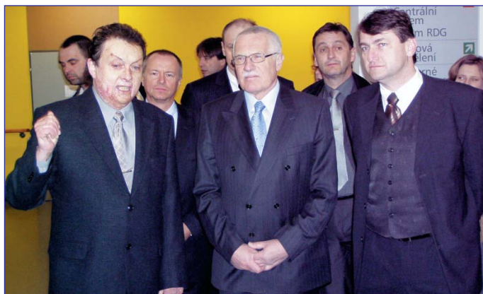
V nemocnici si hlava státu prohlédla heliport a radiologické oddělení.