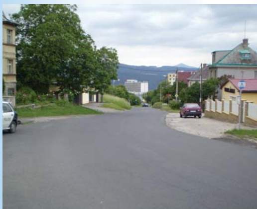
ul. Stříbrnická, ul. Kočkovská