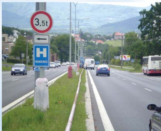
ul. Sociální péče, ul. Petrovická