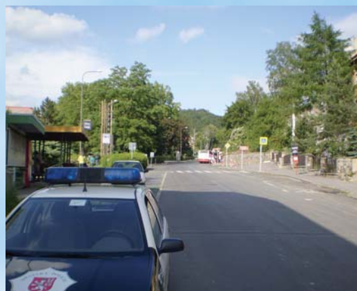
ul. Karla IV.