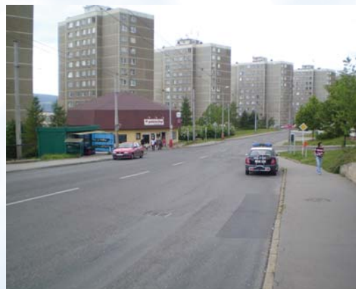
ul. Šrámkova, ul. Výstupní