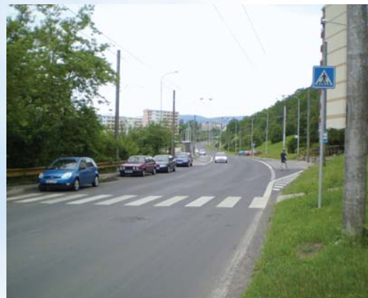
ul. Vinařská - sídliště Pod Holoměří