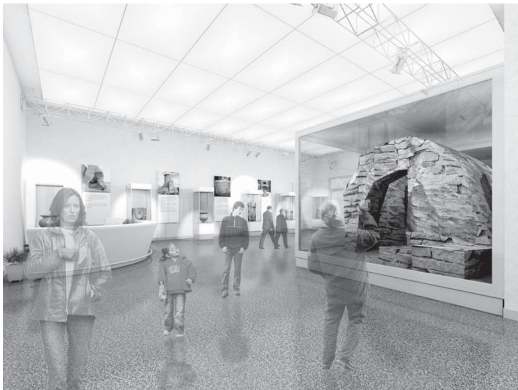
Umístění gotického portálu v Paláci Zdar, zatím jen na studiovém snímku.

Součástí 2. etapy bude přemístění vstupní gotické šíše do nově