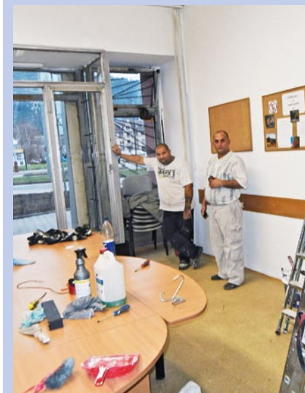
Informační středisko se připravuje.