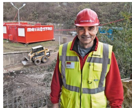
Ing. Radek Zeman má všechno na povel.

končena do konce srpna-září příštího roku. Dokud nebude plavecká hala zkolaudována, stále to bude staveniště. Takže ne, na Klíši se v létě nevykoupete.