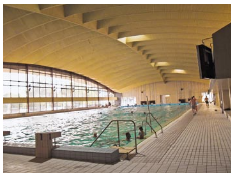
Plavecká hala 30. června: zavírá se. Plavecká hala 4. prosince: zbouráno.

Byla by jednodušší na projektovou dokumentaci a projednání, protože na aquapark je třeba územní rozhodnutí a stavební povolení, což si rovněž vyžádá finance. Zabývat se venkovním areálem na Klíši jako takovým bude nezbytné, protože v letním bazénu jsou už dnes viditelné trhliny.