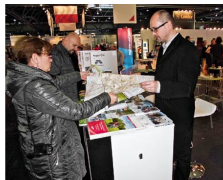
Ústí nad Labem k návštěvě úspěšně lákalo lyžaře i cyklisty.