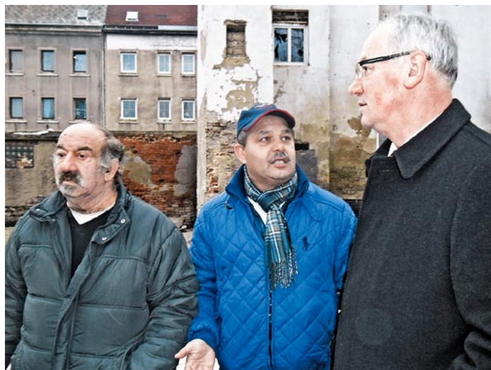
Předlická realita roku 2014. Starousedlíci pamatují a opět chtějí přivítivé Předlice.