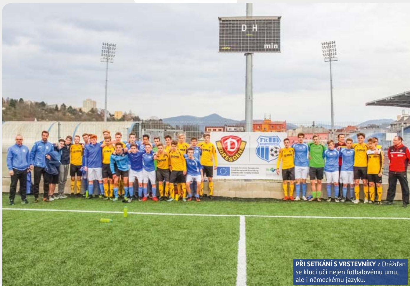
PŘI SETKÁNÍ S VRSTEVNÍKY z Drážďan se kluci učí nejen fotbalovému umu, ale i německému jazyku.

KDYŽ PŘIJEDETE DO DRÁŽĐAN, URČITĚ SI VŠIMNETE, ŽE TOTO MĚSTO FANDÍ FOTBALU.