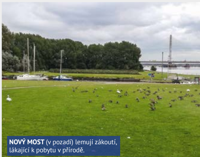
NOVÝ MOST (v pozadí) lemují zákoutí, lákající k pobytu v přírodě.