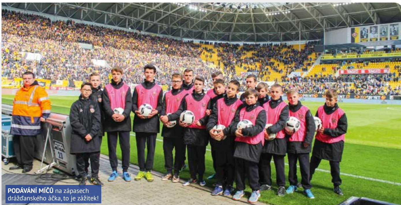
PODÁVÁNÍ MÍČŮ na zápasech drážďanského áčka, to je zážitek!