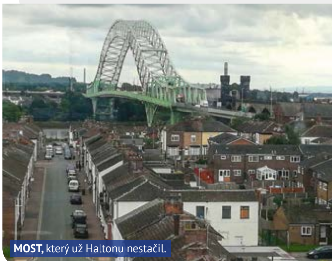
MOST , který už Haltonu nestačil.

Jitka Stuchlíková